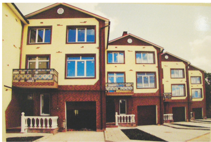
Малоэтажное строительство в Подмоскowie имеет хорошие перспективы

Постоянный участник выставки «Мытищинская городская проектная мастерская» (МГПМ), кроме уже известного проекта застройки левого берега Яузы между Перловкой и селом Тайнинское, представила картинку фасадной части школы олимпийского резерва, строительство которой уже началось на территории школы № 26. Проект «тянет» на 97