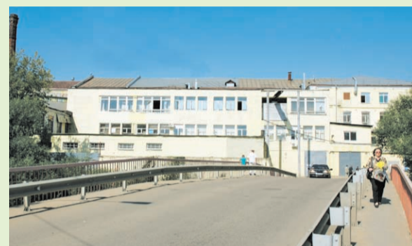
Фабрика «Пролетарская Победа»

Заккрытие конкурса эстрадной песни. Праздничный салют.