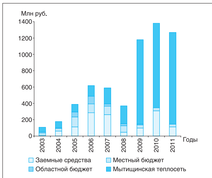
Рис. 1. Структура источников финансирования реконструкции

Высвобожденные экономические резервы, сокращение потерь позволили расширить объем реконструкции и приступить к выполнению более масштабных задач. Предприятию стала под силу дорогостоящая реконструкция больших и мощных котель-